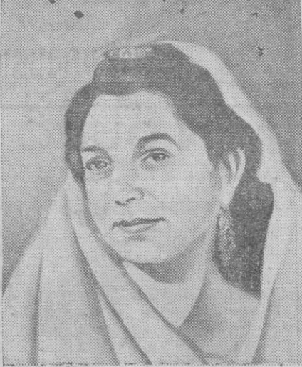
Regum Liaquat, esposa del primer ministro del Pakistán

Nueva York, 8 (1 t.).—El primer ministro del Pakistán, Liaquat Ali Khan, y su esposa, Regum Liaquat, han sido invitados de honor de los señores Rockefeller, en un local situado fuera de la ciudad. Liaquat Ali Khan manifestó en la cena que su país desea la ayuda del capital norteamericano, ofreciendo las garantías necesarias.—Efe.