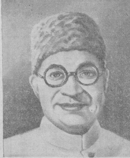
Liaquat Ali Khan primer ministro del Pakistán