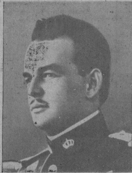
El príncipe Rainiero III de Mónaco

El príncipe Rainiero III ha subido al Trono de Mónaco