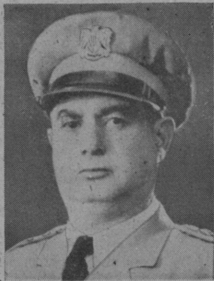
El coronel Husni el Zaim, que tras el golpe de Estado que hace meses dio en Siria, ha sido elegido Presidente de la República