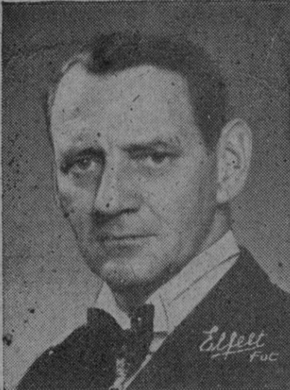
El Rey Federic de Dinamarca, que mañana, 11 de Marzo, cumplirá cincuenta años