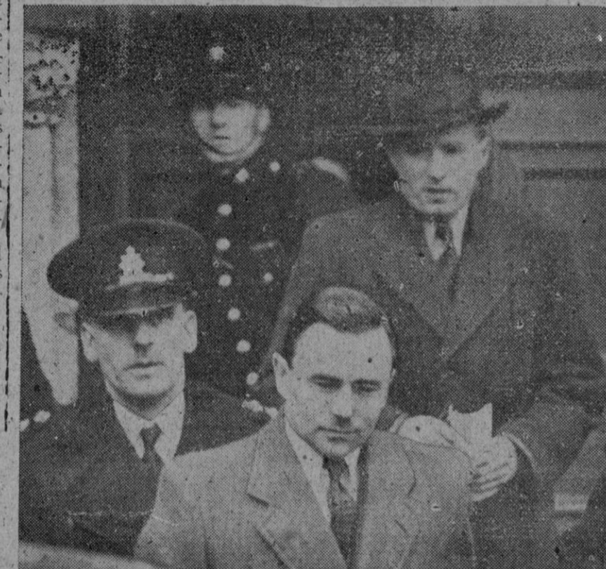
He aquí, en primer plano, a John George Haigh, dueño de un establecimiento industrial inglés que acaba de confesar a la Policía sus repugnantes crímenes. La fotografía está tomada en el momento de ser detenido en su casa de Horsham, Sussex (Inglaterra), para ser conducido a Londres