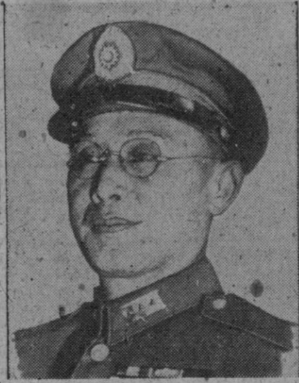
El general nacionalista Ho Ying-Chin, viceministro de Defensa, a quien se ha considerado probable sucesor del actual primer ministro Sun Fo

Bruselas, 2 (6 t.).—Setenta generales han dirigido una carta a mister Churchill rogándole rectifique las declaraciones que hace en sus memorias sobre las circunstancias en las que el Rey Leopoldo se vio obligado a rendirse en 1940.—Efe.