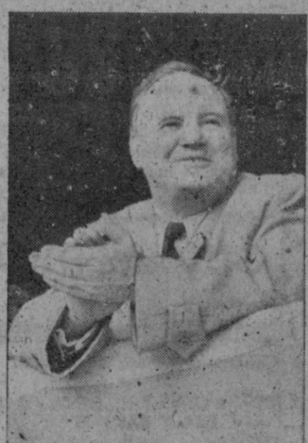
Maurice Thorez, jefe de los comunistas franceses, que ha provocado una oleada de indignación en Francia con sus declaraciones de que el Ejército soviético sería recibido como amigo si invadiese el territorio francés.

Zaragoza, 1.—El gobernador ha cambiado impresiones con los señores Huesca y Lérida para aunar esfuerzos y ver de encontrar solución al problema que afecta a la región de Los Monegros, a cuyos habitantes les lleva el agua por medio de gruesas tuberías. Dentro de breves se celebrará en Bujaraloz una asamblea, con el concurso de numerosos pueblos de aquella comarca, en la que serán formuladas las conclusiones de las autoridades de las tres provincias. Presentarán a la superioridad el problema de Los Monegros, data de veintiseis años, y de resolverse las guerras de independencia de Malaca, Indonesia, Vietnam y Birmania, pero también necesitamos ampliar nuestro frente de África.—Efe.