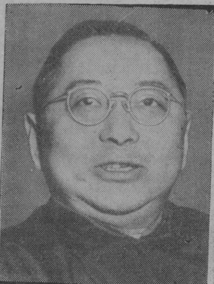
Sun Fo, presidente del Gabinete de guerra chino

Shanghai, 4 (1 t.).—El Consejo municipal ha enviado un telegrama a Chang-Kai-Chek expresándole su «más decidido apoyo» en el mensaje de paz de año nuevo, y diciéndole que tan pronto como los comunistas se muestren dispuestos a ello, Chang-Kai-Chek debe concertar con los mismos una tregua.—Efe.