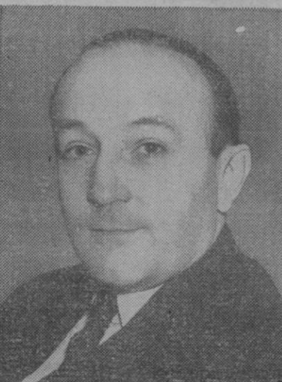
Frank Roberts, antiguo ministro de Inglaterra en Moscú, que será designado para una representación en la India