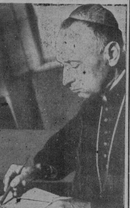
El cardenal primado de Hungría, Joseph Mindszenty

La detención del Primado de Hungría forma parte de un vasto plan