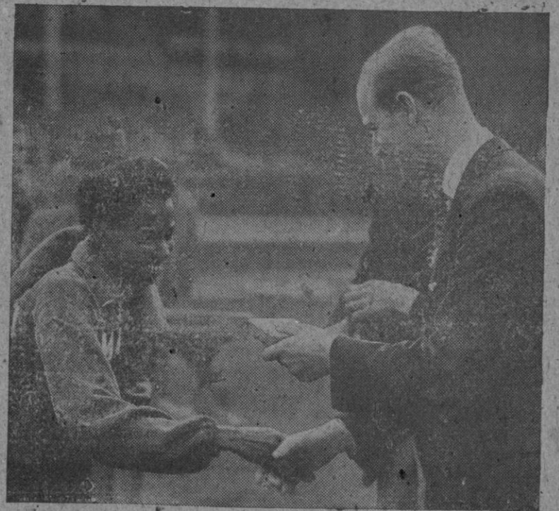
Su Alteza Real el duque de Edimburgo entrega medallas a los atletas ganadores en el encuentro entre los Estados Unidos y el Imperio británico. En la fotografía aparece entregando su medalla a la señorita Thompson, de Jamaica, ganadora de la prueba de los 400 metros.

Y la Policía pide a los cariñosos gritadores que guarden silencio