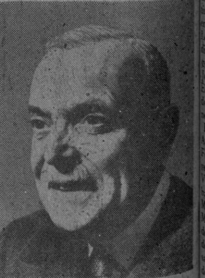
Louis Saint Laurent

Buenos Aires, 15.—El español Valdés ha vencido al argentino Díaz por fuera de combate en el tercer asalto.