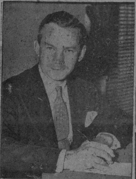
El secretario de Defensa de Estados Unidos, Forrestal

Frankfort, 14.—Acompañado por el general Clay, y procedente de Berlín, ha llegado al aeropuerto francortés el secretario de Defensa de los Estados Unidos, James Forrestal, quien a preguntas de los periodistas, dijo que en Washington está en estudio el refuerzo del puente aéreo a Berlín, mediante el empleo de un nuevo tipo de transporte. Ese servicio lo realizan hoy principalmente aviones C-54. Forrestal declaró que ha enviado su dimisión a Truman, y que a éste corresponde señalar la fecha de su cese.