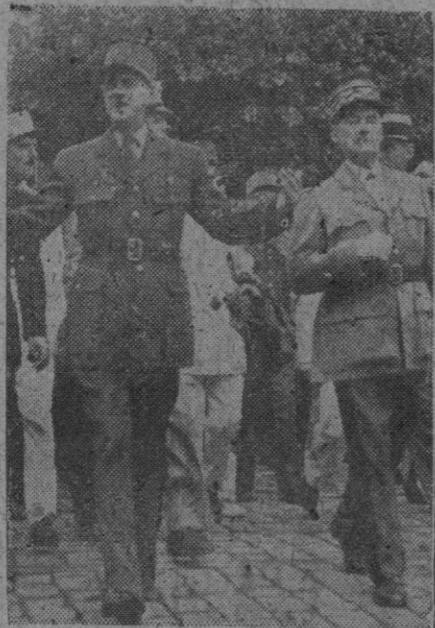
El general De Gaulle (a la izquierda), acompañado del también general Deschamps, fotografiado en una calle de Argel en actitud de corresponder a las demostraciones de simpatía de que es objeto por parte del público.

Se añade en los círculos políticos que De Gaulle tendrá aproximadamente el 33 por 100 del total de escaños de la Alta Cámara o Consejo de la República, y que con las fuerzas que obtenga de los otros partidos derechistas, De Gaulle ejercerá el control sobre la Asamblea Nacional.—Efe.