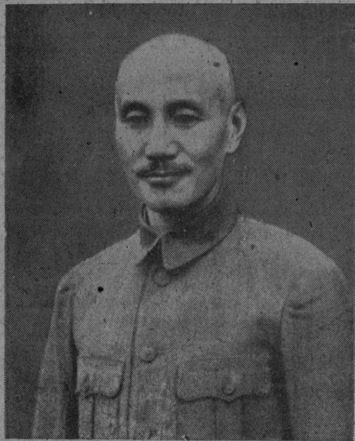
Mariscal Chang Kai Chek

Nankín, 8 (4 t.)—Chang Kai Chek ha declarado que el pueblo debe prepararse para continuar la lucha, dada la crisis que amenaza al Norte de China. Añadió que el Gobierno nacionalista está decidido a luchar contra el comunismo a pesar de los reveses que han hecho perder la Manchuria y han abierto el camino hacia Nankín a tres ejércitos comunistas.