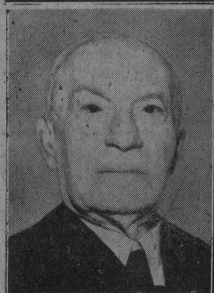
Temístocles Sofulis (Sophoulis) jefe del Gobierno griego

Nueva York, 8 (4 t.)—Grecia ha advertido a los Estados Unidos que sólo dos mil personas han sido ejecutadas en Grecia, legalmente, desde que comenzaron los rebeldes sus actividades. Las cifras dadas por Grecia en contestación a un requerimiento de los Estados Unidos, basado en el intento de contraatacar la propaganda comunista, muestra que 1950 personas fueron ejecutadas entre la liberación de 1945, y el 30 de Septiembre de este año. De ellas, 233 se hallaban consideradas como criminales vulgares, cuatro como colaboradores de los nazis y 1.689 fueron sentenciadas por Tribunales de guerra. Prácticamente todos ellos eran seguidos del general Markos, y fueron capturados como guerrilleros.—Efe.