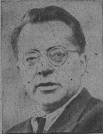
Palmiro Togliatti, secretario general del partido comunista italiano

Un estudiante hizo contra él cuatro disparos, habiéndole herido gravemente