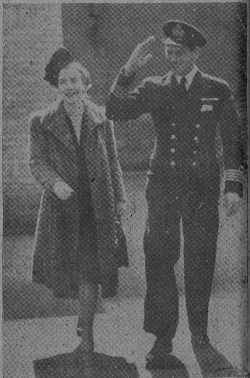
La Reina Ingrid de Dinamarca, acompañada de su esposo el Rey Federico VIII

Copenhague, 14 (urgente).—La Reina Ingrid de Dinamarca ha resultado herida en un accidente de automóvil, cerca de Grax Sten, en Jutlandia. El coche en que viajaba la Reina chocó contra un árbol de la carretera. La Reina sufre una herida en la rodilla, y las tres pequeñas princesas, lesiones leves. El chófer ha resultado conmocionado. El automóvil ha quedado completamente destruido.—Efe.