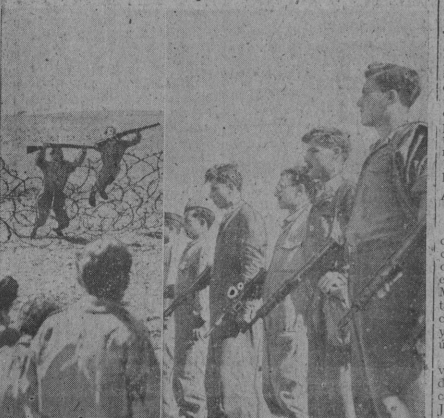
Combatientes de la organización judía en ejercicios militares. A la izquierda, forzando una alambrada. A la derecha, un grupo armado con fusiles ametralladoras

Jerusalén, 3 (1 t.).—Varios individuos vestidos con uniformes de la Policía árabe, penetraron en un cuartel de Policía en el centro de esta capital, apoderándose de setenta y cinco rifles y de varias ametralladoras.