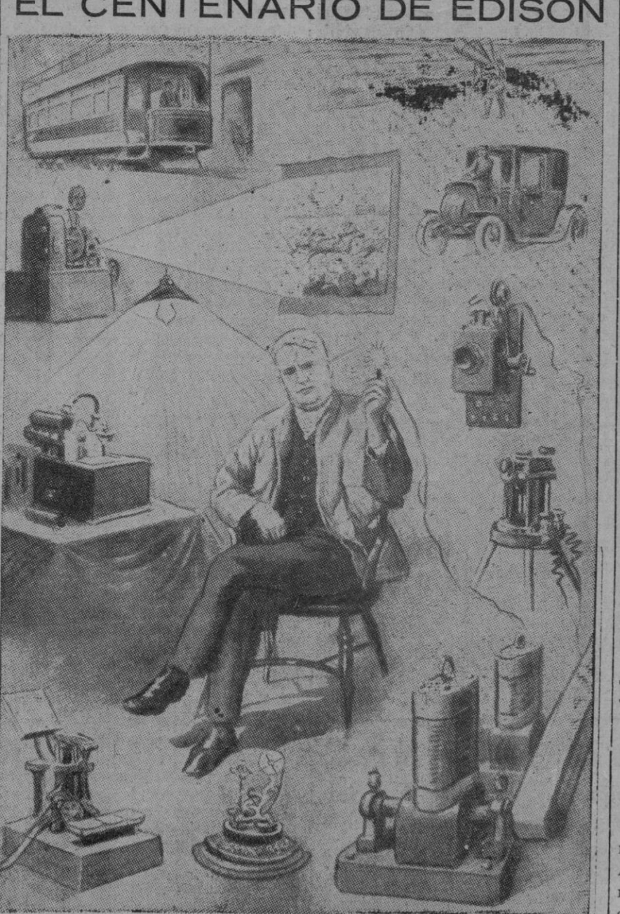
El 11 de Febrero de 1847 nació el gran inventor americano Thomas Alva Edison, que dedicó toda su vida al estudio de los problemas de electricidad, atribuyéndosele más de mil trescientos inventos. En la presente composición fotográfica vemos a Edison y sus inventos más conocidos, tales como el telegrafo perfeccionado, la lámpara eléctrica con filamentos de carbón, el aparato de proyecciones cinematográficas y, finalmente, su más célebre invención: el fonógrafo