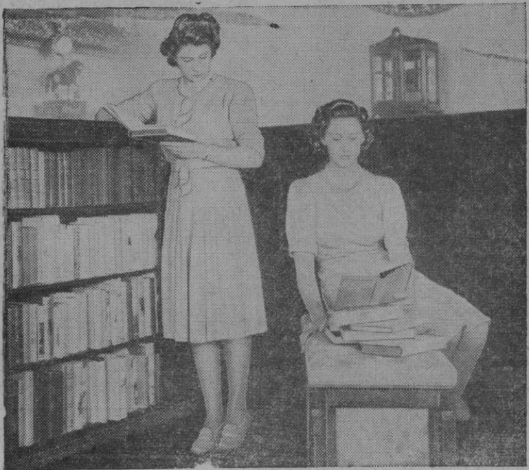
He aquí a las Princesas Elizabeth y Margaret Rosse fotografiadas, en su biblioteca particular del Palacio de Buckingham días antes de partir para Sudafrica

Londres, 3.—La Princesa Isabel, durante el viaje de la Familia Real por Africa del Sur, ha inaugurado un nuevo muelle, bautizado con su nombre. «Este es un joven y gran país—dijo la Princesa—y por todas partes encuentro sentimientos de juventud y fuerza».