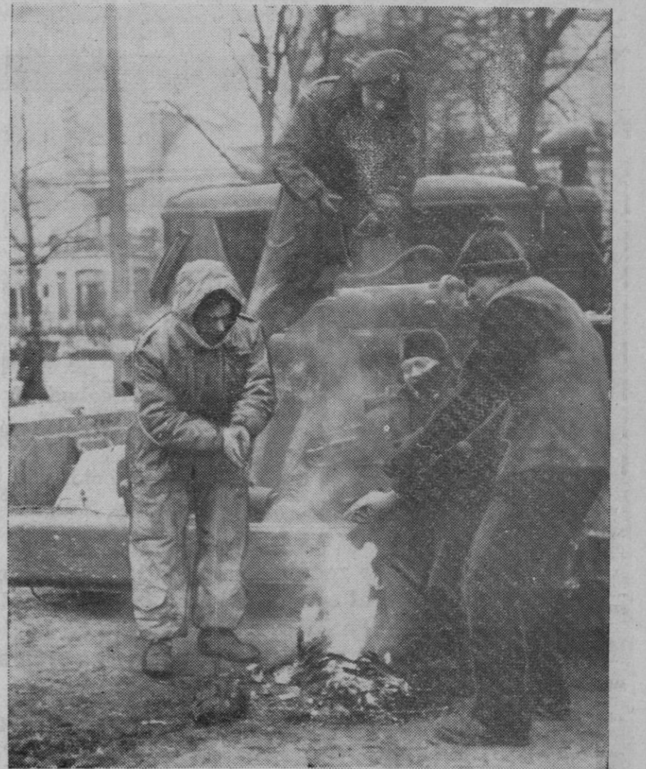
El frío continúa siendo muy intenso en Europa, haciéndose insoportable en los países que carecen de combustible. Nuestra foto está tomada en Hamburgo, a veinte grados bajo cero. Un camión inglés ha sufrido una avería, y mientras la repara el chófer alemán, los demás ocupantes del vehículo se desentumecen junto a una pequeña fogata

Ginebra, 12 (7 t.).—Después de una ligera mejoría, en la mayor parte de los países de Europa ha vuelto a descender la temperatura. En Berlín se registraron nuevamente doce grados bajo cero, y se teme que el termómetro descienda más esta noche. En las últimas veinticuatro horas han muerto de hambre y de frío cinco personas. En Austria la temperatura media es de siete grados bajo cero. Nieva intensamente en los países nórdicos y del Este.—Efe.