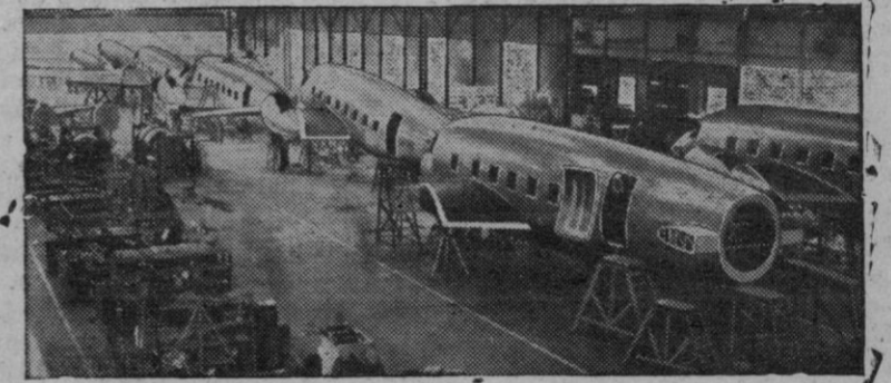
Vista interior de uno de los talleres de la Vickers-Armstrong, donde se construyen los aviones Vikings para la B. E. A. C. Este nuevo tipo de avión reemplazará en breve a los aviones Dakotas americanos, que prestan sus servicios actualmente