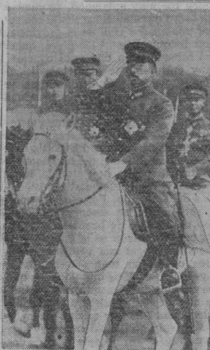
Hiro-Hito, antes de descender de su "sagrado pedestal", presencia un desfile militar el día de su cumpleaños. Le vemos en la foto montado en su famoso caballo blanco

La familia real vive separada. El Emperador y la Emperatriz habitan una parte del tiempo en una casa de madera, una especie de chalet, que es casi el único edificio de la ciudad imperial que ha quedado en pie después de los bombardeos, y otra parte en el refugio construido, a 30 metros de profundidad, para defensa contra los ataques aéreos. Los niños viven con sus abuelos en el campo, aunque todos los días van a la ciudad para comer con sus padres. Después