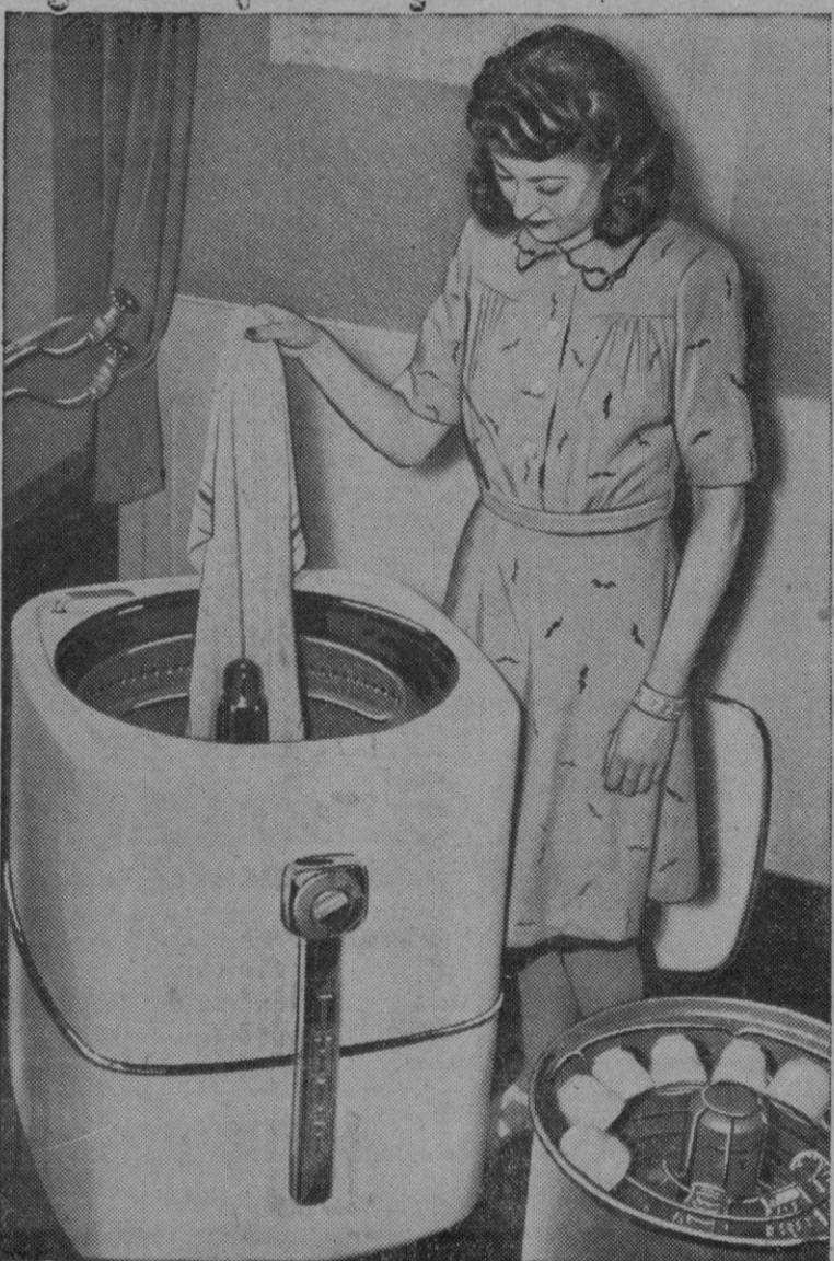
Nueva máquina de lavar inglesa. En la foto vemos la primera lanzada al mercado después de la guerra