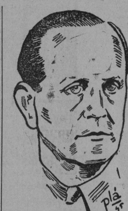
El ministro de Justicia, don Raimundo Fernández Cuesta

Condenados por el delito de rebelión cometido entre el 18 de Julio de 1936 y 1 de Abril de 1939, en que terminó la guerra, en su mayoría autores de delitos comunes, 6.114; condenados por delitos comunes contra la vida e integridad personal, la propiedad, la honestidad y otros delitos, 10.752; procesados por los mis-