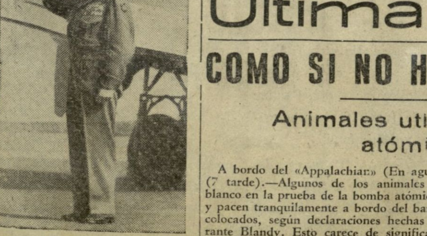
El mariscal Montgomery, al volver desde Alemania a su país, saluda en el aeródromo a los oficiales que le despidieron