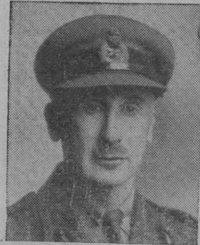
El teniente general sir Evelyn Barker, comandante en jefe de las fuerzas británicas en Palestina

Las tropas están atrincheradas en algunos puntos