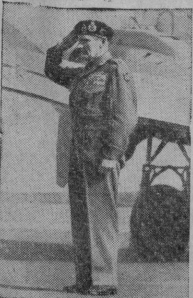
El mariscal Montgomery, al volver desde Alemania a su país, saludada en el aeródromo a los oficiales que le despidieron