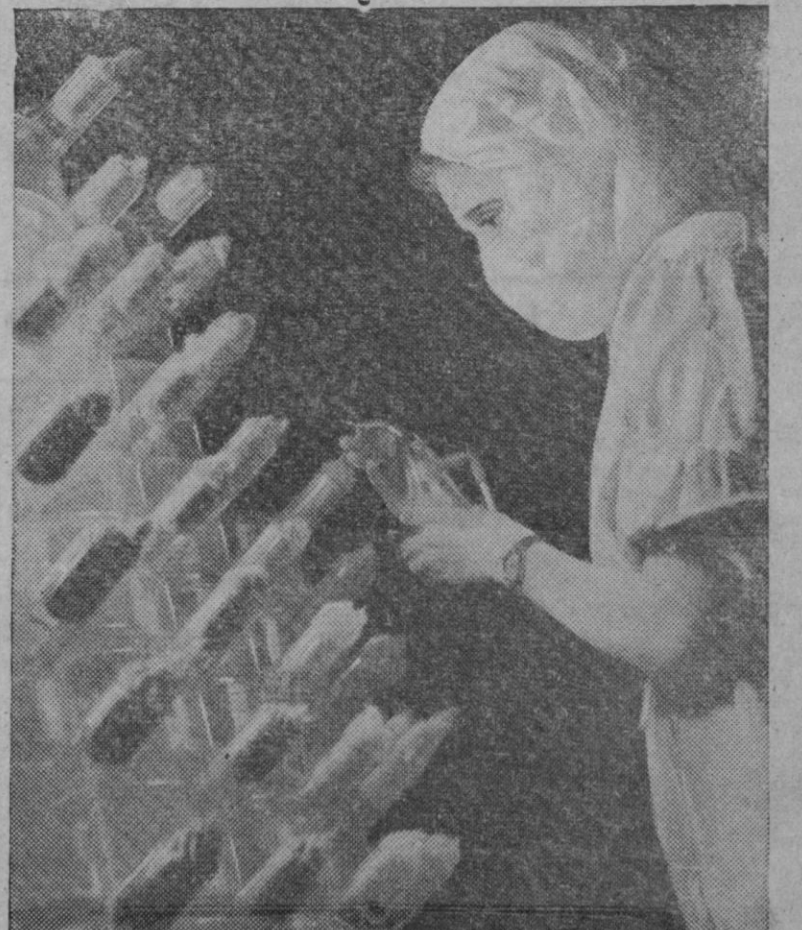
La Gran Bretaña empezó a producir el pasado mes de Junio una cantidad suficiente de penicilina para atender las necesidades de la medicina en Inglaterra. Esta operaria de un laboratorio británico, rocia, cubierta de una máscara protectora, los gérmenes para la propagación de la penicilina