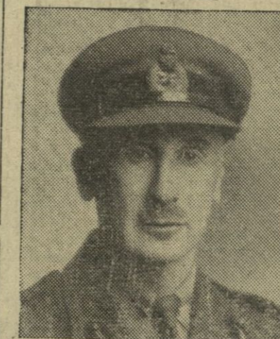
El teniente general sir Evelyn Barker, comandante en jefe de las fuerzas británicas en Palestina

Las tropas están atrincheradas en algunos puntos