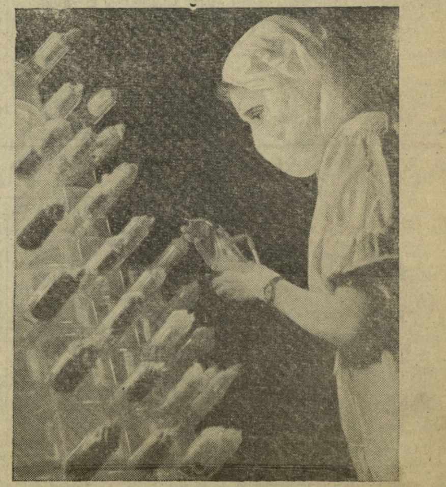
La Gran Bretaña empezó a producir el pasado mes de Junio una cantidad suficiente de penicilina para atender las necesidades de la medicina en Inglaterra. Esta operaria en un laboratorio británico, rocía, cubierta de una máscara protectora, los gérmenes para la propagación de la penicilina