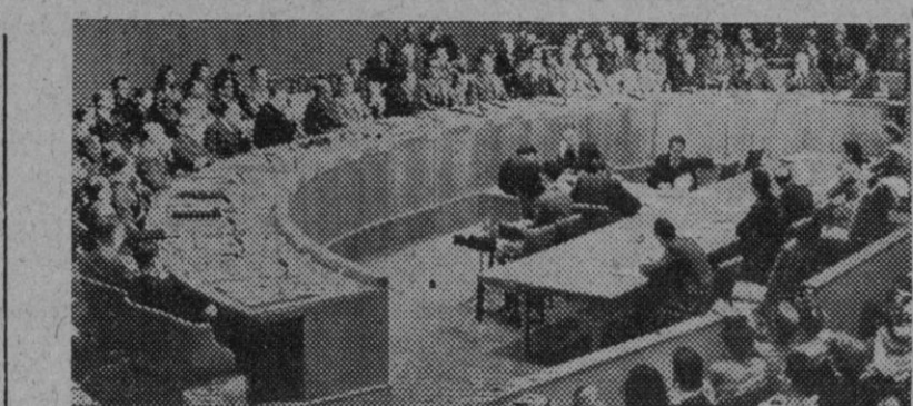
Aspecto general de la primera reunión del Consejo Económico y Social de la O. N. U. en el Hunter College