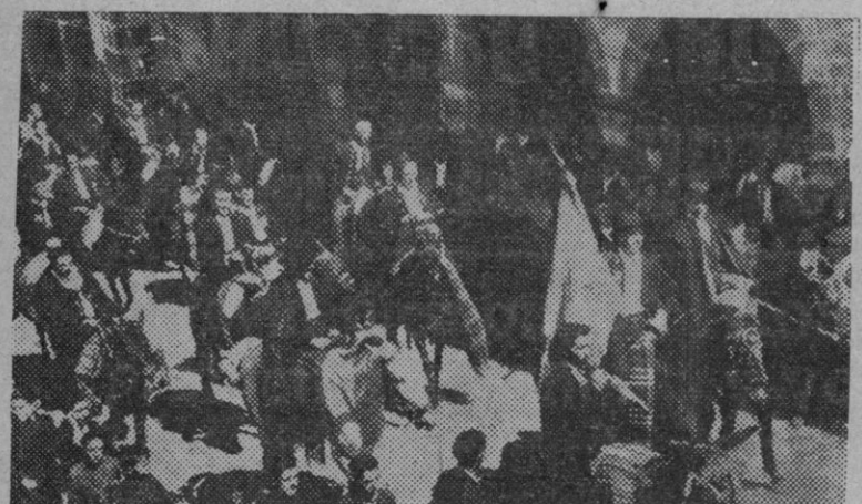
La Cofradía de la Caballada desfila por las calles de Atienza, al regreso de la romería que cada año celebra el domingo de Pentecostés, para conmemorar la liberación de Alfonso VIII en 1163, lograda por los ricuecos o arrieros de Atienza mediante ingeniosa y valiente estrategia.