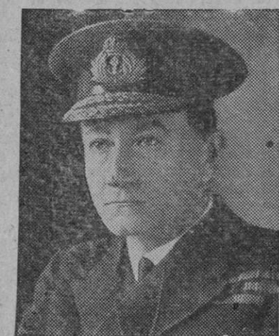
El almirante británico sir John Cunningham, que ha sido nombrado primer lord del Almirantazgo y jefe del Estado Mayor Naval