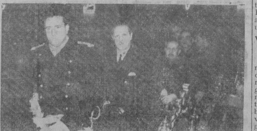
En San Francisco el Grande se han celebrado solemnes funerales por el teniente general Orgaz recientemente fallecido. Al acto concurrieron el Gobierno en pleno, el presidente de las Cortes, jefes y oficiales del Ejército y del Alto Estado Mayor