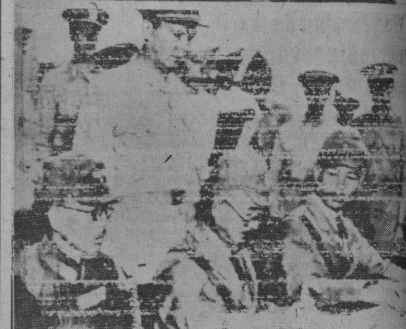
A bordo del acorazado "Missouri" se verificó la firma de la rendición incondicional del Japón ante los aliados. En las presentes fotografías vemos dos momentos diferentes de esta firma, en la que aparecen los comisionados nipones y los delegados de las potencias aliadas presididos éstos por el general Mac Arthur.

Rangún, 13.—Hoy, en la Casa del Gobierno, ha sido firmada la rendición de las tropas japonesas en Birmania, se anuncia oficialmente.—Efe.