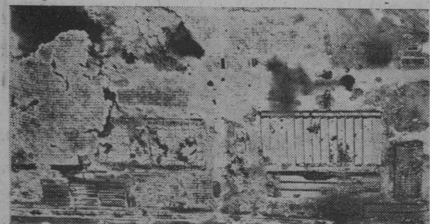
Las fortalezas volantes norteamericanas, día y noche, bombardearon los objetivos militares nipones de la metrópoli. He aquí los efectos de uno de estos bombardeos sobre un aeródromo próximo a Tokio, donde fueron pasto de las llamas las instalaciones y quedó inutilizado el campo de aterrizaje