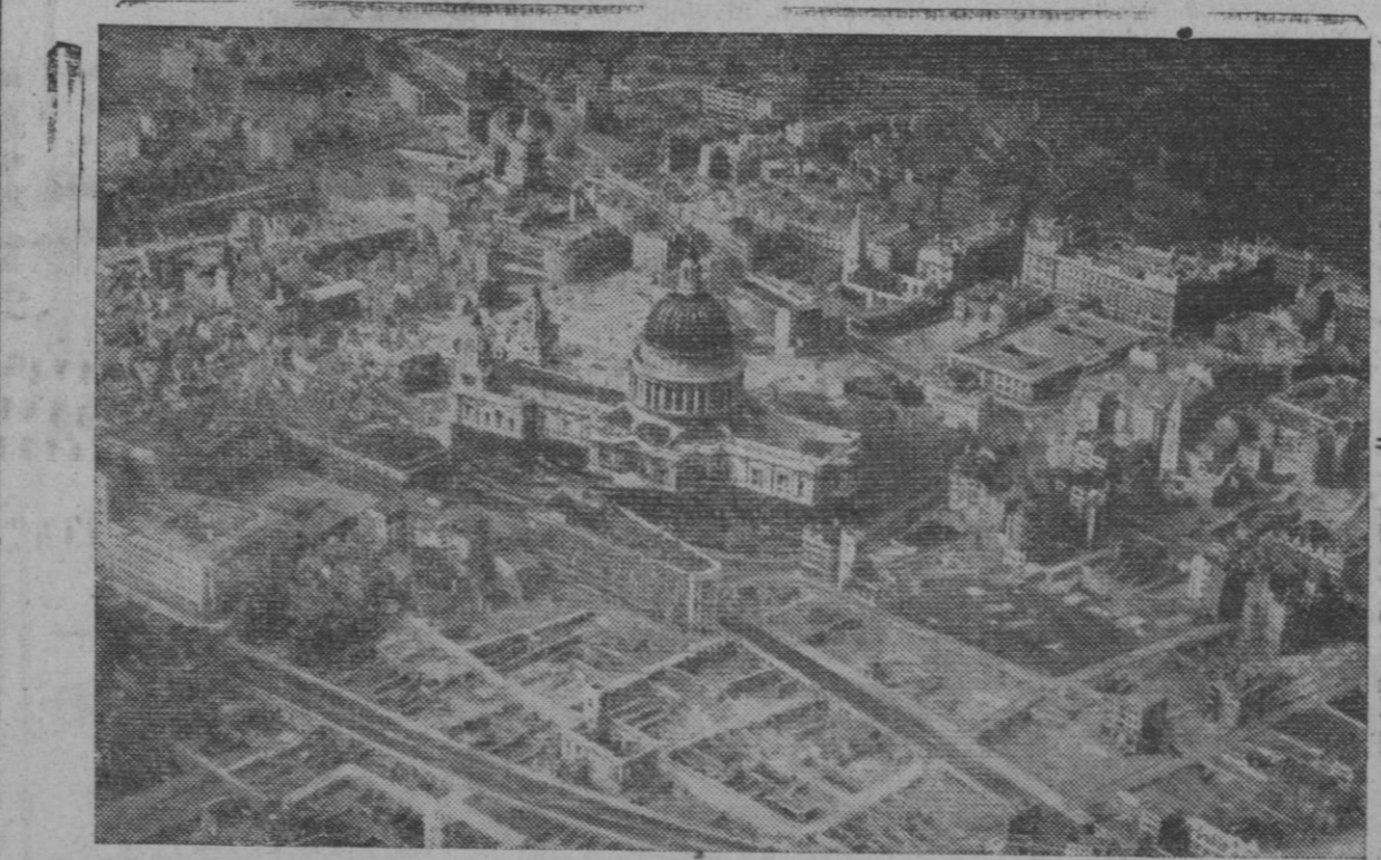
Un sector de la capital inglesa, junto a la catedral de San Pablo, que muestra los daños causados por los bombardeos alemanes