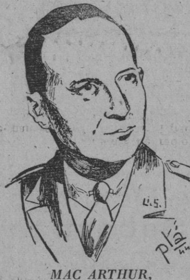
MAC ARTHUR, comandante jefe de las fuerzas de Tierra aliadas en el Pacífico, que ha sido designado para desembarcar en territorio metropolitano japonés y recibir en nombre de los aliados la rendición oficial nipona

Washington, 14 (3 t.).—El general De Gaulle llegará a esta capital el próximo día 22 para tratar con el Presidente Truman sobre el futuro papel de Francia en el Extremo Oriente y acerca de los planes de las grandes potencias respecto a la parte occidental de Alemania.—Efe.