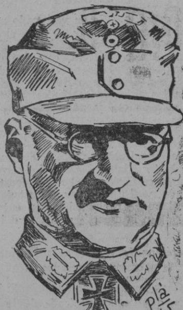
El mariscal Schorner, que defiende el sector septentrional de Prusia Oriental en Curlandia, que ha logrado contener el avance soviético hacia Königsberg, la importante base naval y militar del Báltico y que en los últimos días, tras de ceder Tilsit y Memel, ha afirmado la posición alemana en las proximidades de la capital prusiana.

Berlín, 2.—Potentes columnas soviéticas atacan los puntos de apoyo alemanes de Marienburgo, librando encarnadas luchas cuerpo a cuerpo. Han comenzado los combates por la posesión del célebre castillo de la Orden Teutónica, según anuncia la Oficina de Información Internacional.