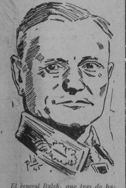
El general Balsk, que tras de haber cedido la capital húngara al Ejército soviético ante el inminente avance de las tropas rojas, ha reaccionado después, consiguiendo plenamente la iniciativa y avanzando en dirección a Budapest, cercada, para liberar a las tropas germano-húngaras que defienden heroicamente la ciudad del Danubio