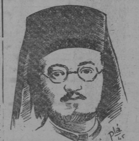
Damaskinos, regente de Grecia y arzobispo ortodoxo de Atenas

ral, en la Península, particularmente en la región centro, se registra un notable descenso termométrico, que ha llegado a diecinueve grados bajo cero en Avila, a las seis de la mañana. En Santaolalla, a setenta kilómetros de Sevilla, ha caído una copiosa nevada, como nunca se había conocido en aquella comarca. En varias regiones los lobos han descendido del monte y se han acercado a pueblos y caseríos.