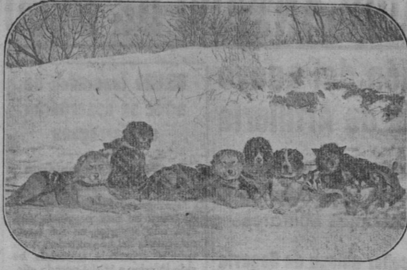
Visitando la misión en trineo

Milones de hombres de las cinco partes del mundo fijarán mañana su vista en las tierras misionales. Todas las almas nobles que sienten la fraternidad cristiana y el celo por la conversión de los infieles, mancomunarán sus oraciones y limosnas en generoso esfuerzo de evangelización.