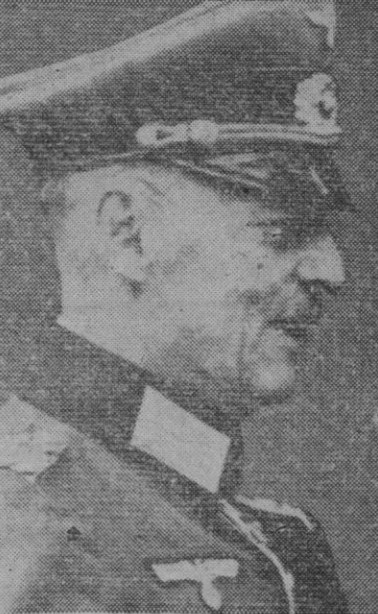
El mariscal von Rundstedt, jefe de las fuerzas alemanas de contrainvasión