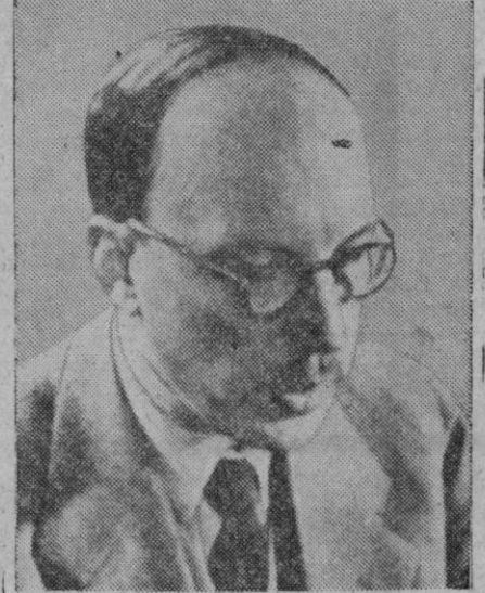
Risto Ryti, Presidente de Finlandia

Cuartel general aliado en Italia, 22 (2 t.).—Pedro de Yugoslavia y el doctor Subasic, su primer ministro, han llegado a Italia. Ambos conferenciaron con el general Wilson sobre la situación en Yugoslavia. Actualmente visitan el frente, invitados por Alexander.—Efe.