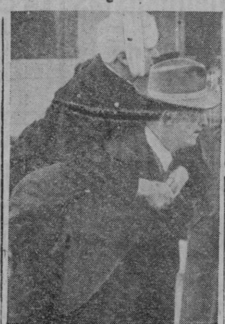
DESPUES DEL ATAQUE CONTRA LA CIUDAD SUIZA DE SCHAFFHAUSEN.—Un miembro del grupo de salvadores voluntarios llevando en sus espaldas a una víctima del bombardeo

Ese aplastante golpe a la producción petrolífera alemana—se dice aquí oficiosamente—fué asestado por