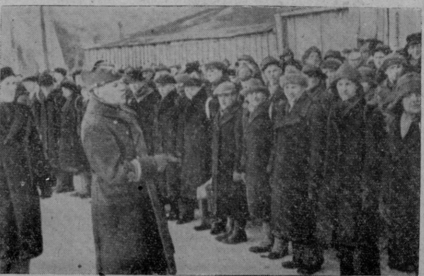
Los últimos reemplazos incorporados se concentran en la plaza central de la ciudad de Pernau