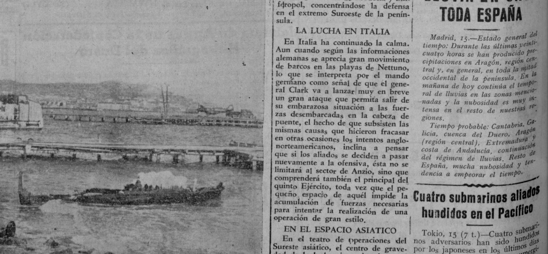
Una vista del puerto de Kerch, con la ciudad al fondo, que hace unos días fueron abandonados por las tropas germano-rumanas