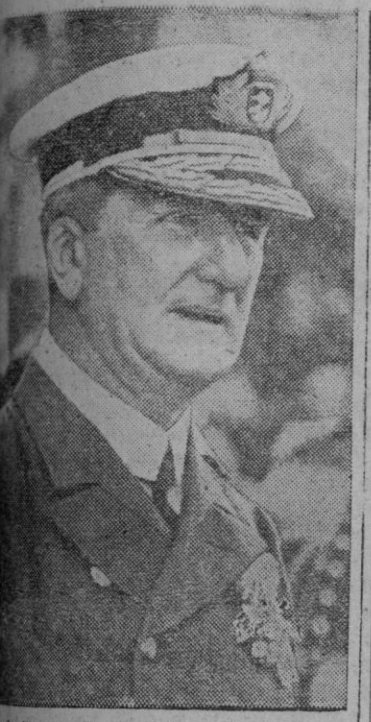
Almirante Horthy, Regente de Hungría, quien se dice que, acompañado de su séquito, salió el viernes pasado de Budapest, sin que hasta el momento se haya comunicado el lugar donde se encuentra.