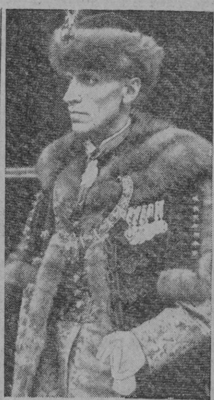
El ex primer ministro, Imreedy, a quien se atribuye la formación de un nuevo Gobierno

En los medios húngaros de esta capital se declara que el almirante Horthy y su séquito salieron de Budapest el viernes último. Todas las comunicaciones entre Budapest y Estocolmo quedaron cortadas desde las veinte horas del lunes.—Efe.