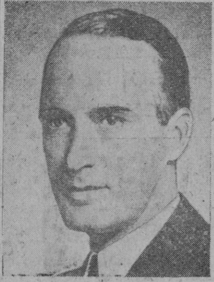
Alfredo de Bohlen y Halbach, actual director de los talleres de la célebre industria siderúrgica Krupp, que ha recibido de Hitler una ordenanza, por virtud de la cual será esta empresa de familia, en la cual ha de contarse como heredero el mismo von Bohlen y Halbach. La ordenanza responde a agradecimiento del pueblo alemán a dicha industria Krupp por los servicios y la defensa que le ha prestado desde hace ciento treinta y dos años.