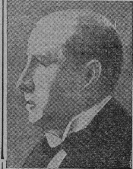
Björn Thordarson, ministro de Estado de Islandia, que en nombre de su Gobierno ha hecho público que en breve se implantará en Islandia la forma republicana de gobierno