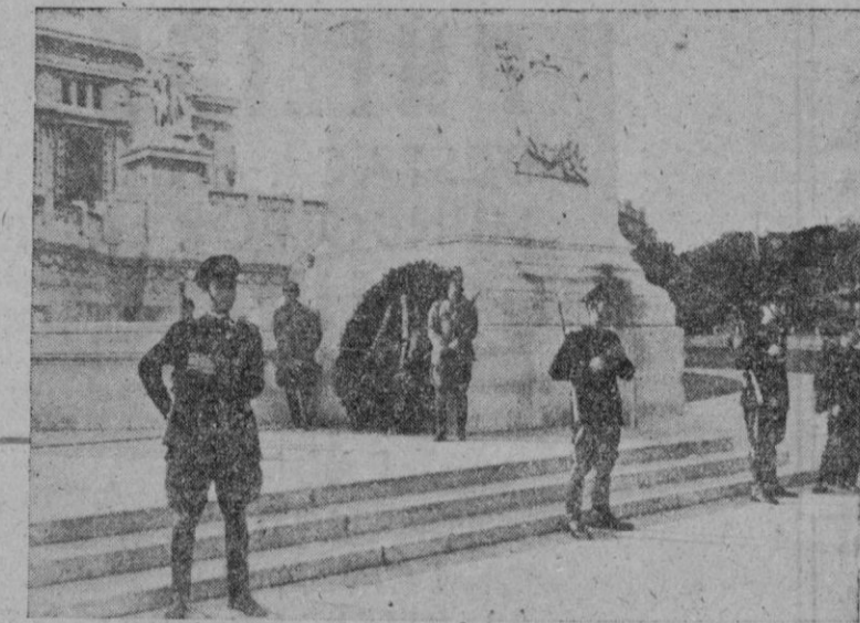
Soldados del Ejército republicano-fascista haciendo guardia de honor en Roma ante el monumento a los caídos

Berlín, 13.—«En el Sur de Italia—comunica la Oficina Internacional de Información—, la actividad de combate quedó imitada ayer a las regiones montañosas del Oeste de Venafro y al Este del ala costera izquierda, en el pequeño río Moro. A pesar del mal tiempo, los alemanes ocuparon algunas alturas alrededor del monte Sammuco, que se encuentra ahora sometido al fuego de las armas pesadas alemanas desde tres direcciones. Los ataques de los norteamericanos, emprendidos para auxiliar a las formaciones comprometidas, se estrellaron con importantes pérdidas para los asaltantes ante la defensa alemana de los valles, y los primeros contrafuertes. Nada más que ante la línea de fuego de cinco fusiles ametralladores y nidos de lanzagranadas pudieron contarse 164 muertos del adversario.»