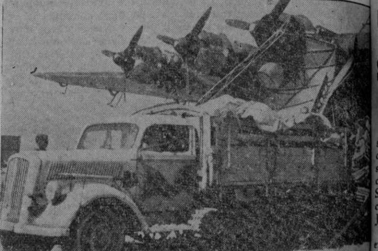
El mismo aparato en el aeródromo de destino. Del avión gigante, de transportar 130 hombres, piezas artilleras, baterías anticarro, etc., salen directamente estos últimos como se aprecia en la fotografía