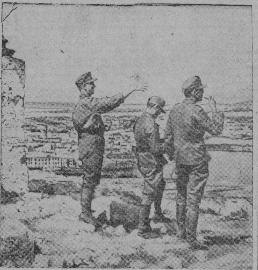
Soldados alemanes haciendo observaciones en la zona oriental de la península de Kertsch antes de comenzar la batalla que allí se libra actualmente