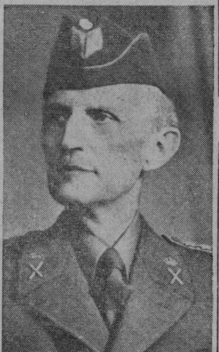
El príncipe Carlos, presidente de la Cruz Roja de Suecia, que tomó a su cargo el planeamiento y el canje de los prisioneros, mientras estuvieron detenidos en país sueco