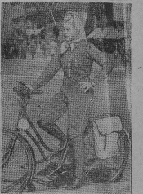
La escasez de telas ha llegado a hacer que vuelvan a sacarse de los oscuros guardarropas los trajes antiguos. Pueden verse en las grandes ciudades europeas, como se demuestra por la presente foto, muchachas con vestidos inspirados en modas antiguas, marchando a través de las calles en su modernísima bicicleta