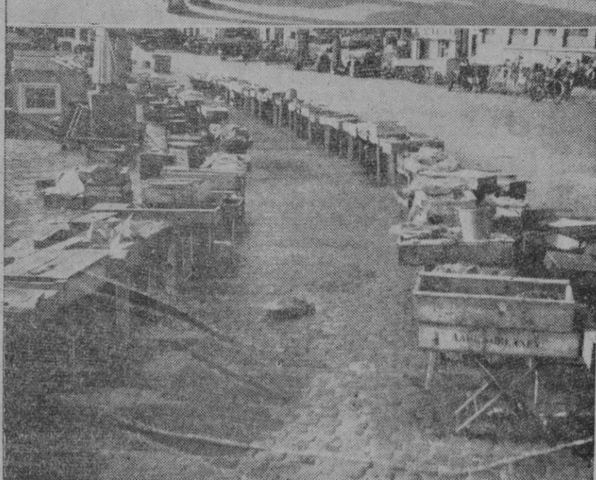
Han sonado las sirenas de alarma en la capital de Dinamarca, e inmediatamente las calles han quedado desiertas de gente. En nuestra foto se ven, arriba, los caballos de un carro de cerveceros, atados al carro en medio de la calle desierta de hombres. Abajo, la célebre plaza del mercado del pescado, llamada «Gammelstranden», sin las mujeres vendedoras.