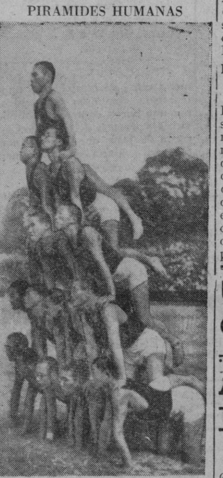
En la gimnasia japonesa se da mucha importancia a la decoración, para lo cual se trabaja a base de grupos acrobáticos

Lisboa, 3.—El periódico «Diário da Manhã» previene de nuevo contra el bolchevismo, enmascarado como movimiento nacional. «No hay una Rusia—dice el diario—, sino una U. R. S. S. Stalin sigue siendo el «padre» de todos los pueblos y sus ejércitos llevan la bandera roja, símbolo del comunismo, con la hoz y el martillo, emblema de la dominación de una sola clase. Los bolcheviques con-