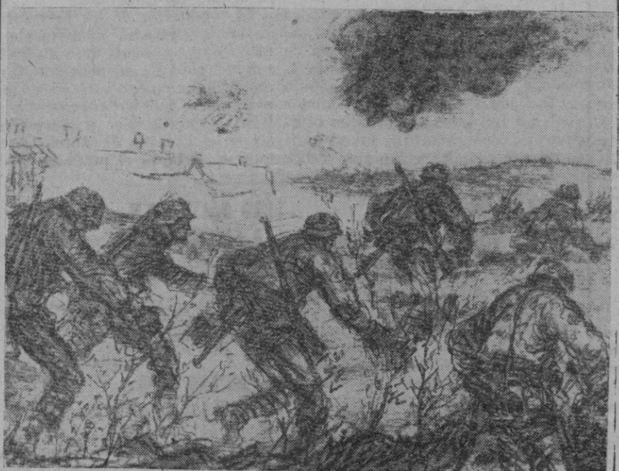
Dibujo de un corresponsal de guerra alemán en que se ve a un grupo de infantes lanzándose contra las trincheras enemigas

Contraataques alemanes coronados por el éxito en los accesos septentrionales de la península