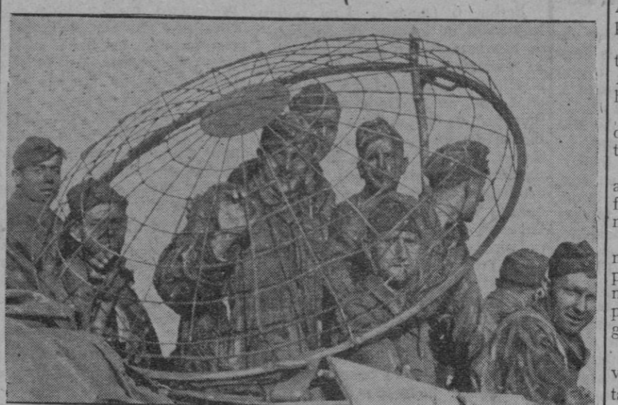
Blindaje empleado por los soldados alemanes contra las granadas de mano

Los aliados dicen que las tropas del Reich luchan con tenacidad inaudita