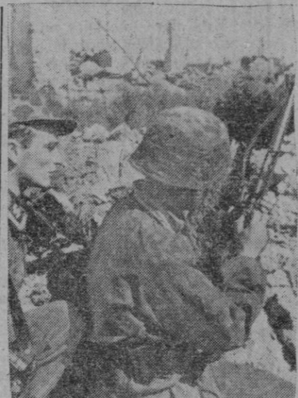
Previendo cualquier intento enemigo, estos soldados alemanes no pierden de vista sus movimientos

En el frente de los lagos Ilmen y Ladoga se señalan operaciones de carácter local.