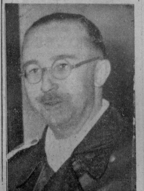
Heinrich Himmler, que ha sido nombrado nuevo ministro del Interior de Alemania