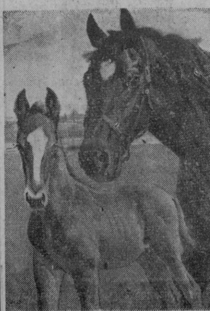
Una yegua de carreras con su potrillo. Se puede apreciar claramente cómo las líneas nobles y puras de la madre se encuentran en el potrillo