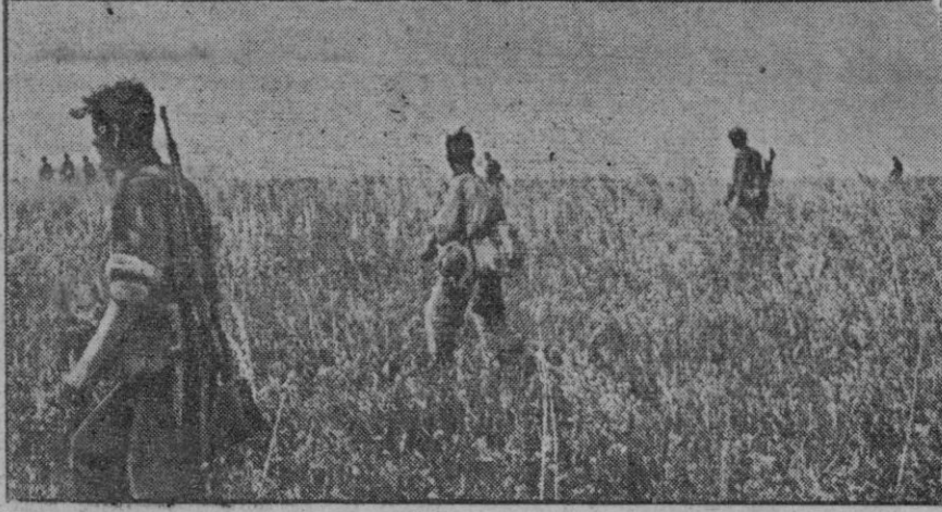
Garnaderos alemanes en servicio de descubierta en un sector del frente oriental