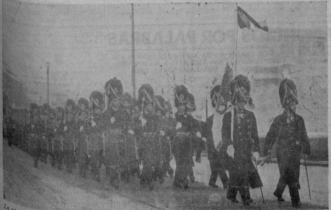
La apertura del Parlamento sueco, se celebra con gran solemnidad. La Guardia de Corps, de gran gala, desfila por las calles de la ciudad