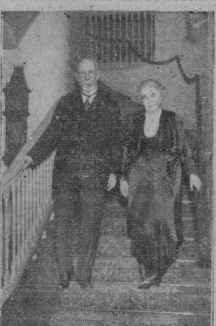
El príncipe Oscar Bernadotte, hermano de Gustavo V, acompañado de su esposa. El príncipe acaba de cumplir ochenta y cuatro años