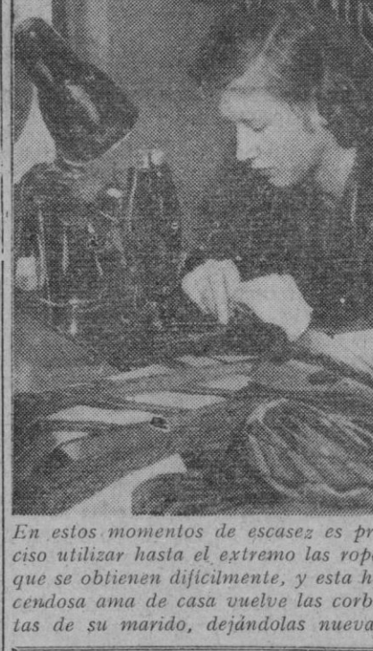
En estos momentos de escasez es preciso utilizar hasta el extremo las ropas que se obtienen difícilmente, y esta hacendosa ama de casa vuelve las carbas de su marido, dejándolas nuevas.