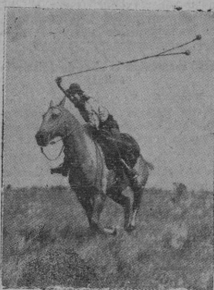
Si bien el avestruz sudamericano no tiene el valor de su congénere africano, su caza constituye para el gaucho un deporte apasionante, en el que tiene ocasión de demostrar su destreza de jinete y su habilidad en el manejo de las bolas