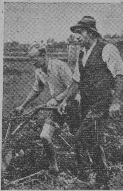
En toda Europa la agricultura se resiente de la falta de brazos, arrebatados por la guerra. Equipos voluntarios de la retaguardia deben sustituir a los combatientes, y en aquellos figuran hombres de todas clases sociales. En la fotografía vemos a un improvisado agricultor, procedente de una cátedra, recibiendo instrucciones de un labriego, sobre el cultivo de los campos.