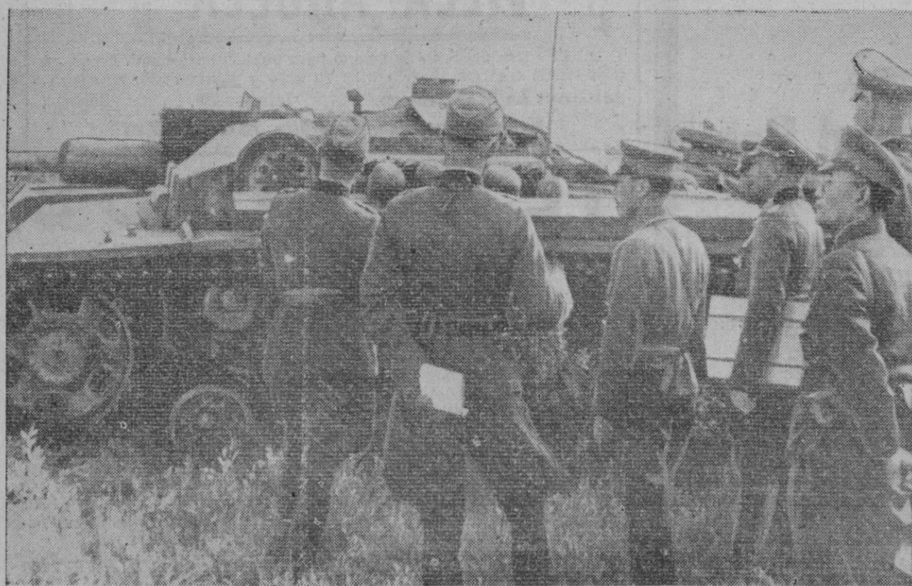
En el Este se libran desde unas semanas las más grandes batallas de material que registra la historia militar. Con esta fase de la guerra coincide la presencia de una misión militar japonesa en las líneas alemanas del frente ruso. En la fotografía aparecen los oficiales japoneses inspeccionando uno de los grandes carros alemanes de asalto.