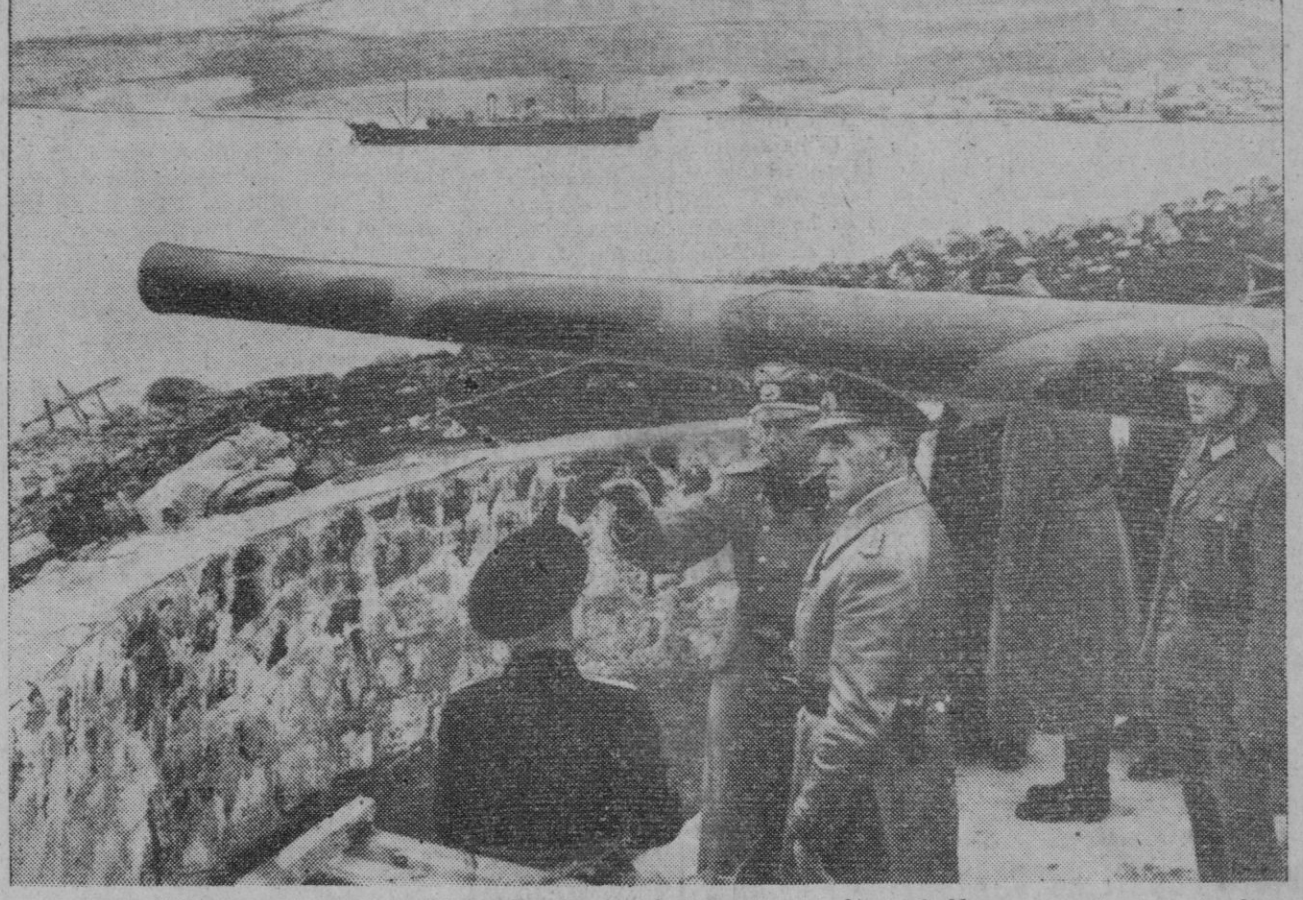
El almirante Ciliat inspeccionando una de las baterías instaladas en la costa Norte de Noruega, constantemente alerta para prevenir cualquier ataque del enemigo.