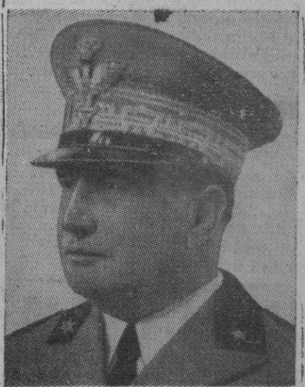
El general Alfredo Guzzoni, que como jefe del sexto Ejército italiano, participó en la defensa de Sicilia