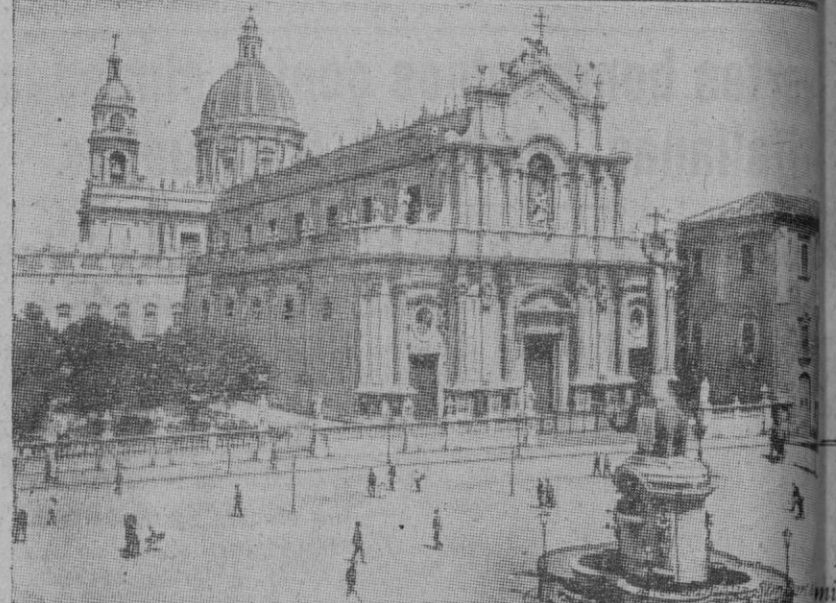
El octavo Ejército británico y las fuerzas canadienses, después de la conquista de Augusta, marcharon contra la ciudad de Catania, por cuya posesión se libraron desde hace varios días durísimos combates. Arriba vemos una vista de la ciudad de Catania y del volcán Etna al fondo. Abajo, la fuente de los elefantes de la misma ciudad y, en primer plano, la fuente de los elefantes

nes, empujan respectivamente en dirección Noroeste y Noreste, sin que hasta el momento el éxito corone sus esfuerzos.