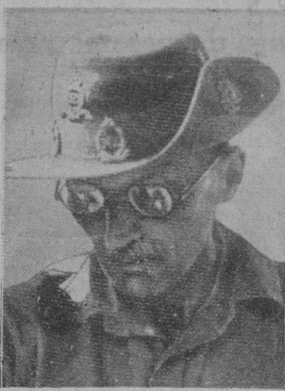
Sir Bernard Montgomery, jefe del octavo Ejército británico, que dirige los combates contra la ciudad siciliana de Catania