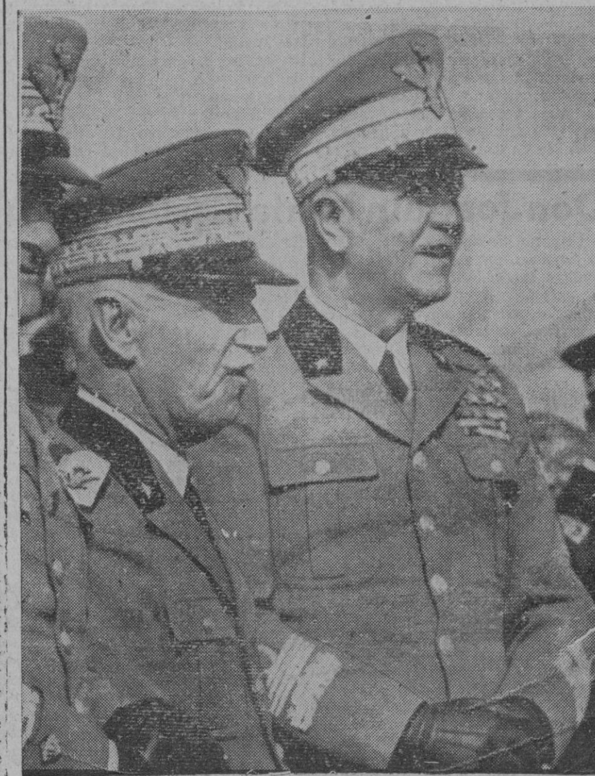
Vemos en la presente fotografía al Rey de Italia, Victor Manuel III, que ha asumido el mando de todas las fuerzas armadas de Italia, acompañado del mariscal Badoglio, que sustituye a Benito Mussolini en los cargos de jefe del Gobierno, primer ministro y secretario de Estado

A TI SANTIAGO APOSTOL LLEGAMOS DESDE LAS TIERRAS DE ESPAÑA HASTA EL BORDE DE TV SEPVLRO SANTO CON LA OFRENDA DE NVESTRO AMOR, DE NVESTRA FE, DE NVESTRA VOLUNTAD LAS FALANGES JUVENILES DE FRANCO. A TI EN ESTA PEREGRINACION APASIONADA TE PEDIMOS EN TV DIA EL TRIUNFO DE LA VERDAD FALANGISTA POR TI Y POR ELLOS LVCHADORES TODOS EN LA DISTANCIA DEL TIEMPO POR EL IMPERIO HACIA DIOS. ¡ARRIBA ESPAÑA!