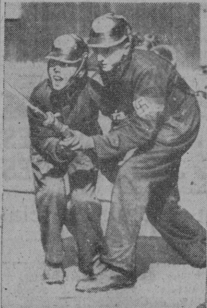
En Alemania se han organizado grandes cuerpos de bomberos formados por los miembros de las organizaciones juveniles, para participar en la defensa pasiva contra los ataques aéreos a las ciudades.

Roma, 20.—Se ha hecho público un comunicado que da cuenta de la entrevista habida entre el Duce y el Führer en términos análogos al comunicado alemán. HITLER HIZO EL VIAJE POR VIA AEREA Berlín, 20.—El lunes por la mañana el Führer salió en avión con sus principales colaboradores de Estado Mayor para una ciudad del Norte de Italia, donde era esperado por el Duce, que le recibió cordialmente. La entrevista se verificó en un edificio muy apropiado a este objeto y no lejos de la ciudad. Las conversaciones se prolongaron hasta la tarde. Después el Führer regresó por vía aérea a su Cuartel general.—Efe.