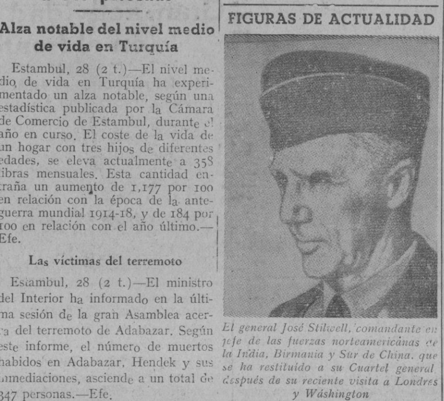
El general José Stilwell, comandante en jefe de las fuerzas norteamericanas de la India, Birmania y Siam del China, que se ha restituido a su Cuartel general después de su reciente visita a Londres y Washington.

Madrid, 28.—El próximo día 1.º de Julio, a las once de la mañana, y en la sección séptima, se reunirá la Comisión de Educación Nacional para conocimiento y estudio del dictamen que la ponencia correspondiente ha emitido sobre el proyecto de ley de Ordenación universitaria.