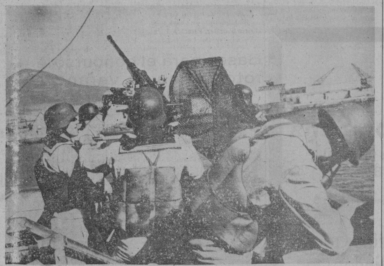
Los ataques aéreos norteamericanos contra la ciudad y el puerto de Napóles, han causado la muerte de 2.300 personas, y otras 8.000 han resultado heridas. Famosos palacios, iglesias y monumentos históricos han resultado alcanzados por las bombas. La ilustración nos muestra un cañón antiaéreo a bordo de un buque de guerra en el puerto napolitano. Al fondo puede apreciarse el Vesubio.

Bombardeo aliado contra Gerbini y Reggio Calabria