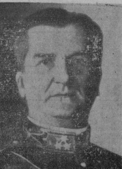
El almirante Nicolás Horthy, Regente de Hungría, que acaba de cumplir sesenta y cinco años de edad.

El acto se terminó cantando todos los asistentes el himno del Reich. Adornaban la sala banderas de todas clases, desde la del Reich hasta la de la Rusia zarista, pasando por la negra de la S. S., la del partido nacionalsocialista, el león negro sobre fondo amarillo de los flamencos y la cruz de Borgoña sobre fondo blanco de los valones.