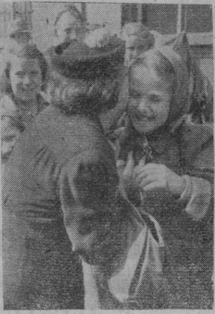
Los niños alemanes trasladados a regiones no afectadas por los bombarderos aéreos, vuelven de vez en cuando a ver a sus familiares que se encuentran en la ciudad. He aquí a una niña recibida con gran alegría por su madre

Sierra, gran, recreo, tranquilidad. Todo esto lo encontraréis en la Residencia-Albergue que la Obra Sindical Educación y Des-canso tiene instalada en San Rafael