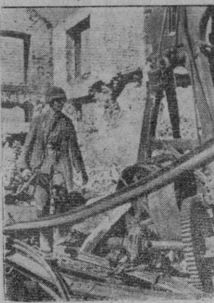
Este soldado alemán camina entre los escombros de una fábrica soviética destruida por el armamento, que fue destruido por la aviación alemana antes de su entrada en un pueblo ruso