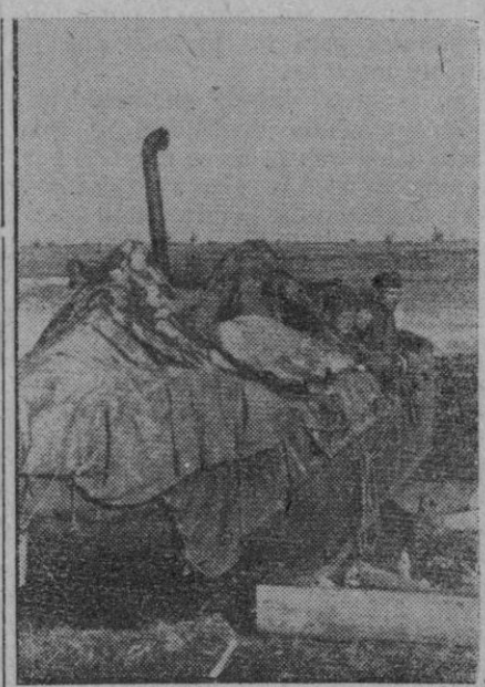
Valiéndose de esta barca se han construido estos soldados, a orillas del lago Ilmen, un magnífico refugio en el cual tienen el máximo confort

París, 22 (2 t.).—La Prensa parisense expone hoy el sentido y alcance de la lucha antibolchevique con motivo del segundo aniversario de la guerra germano-soviética. «Los alemanes—hace constar «Le Matin»—previeron oportunamente la agresión proyectada por los soviets sobre Europa». Marcel Deat, en «L'Œuvre», recuerda que Stalin se había dedicado desde hace muchos años a forjar un