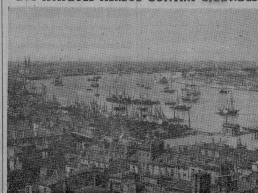
La ciudad francesa de Bordeaux, sobre el Garona, que ha sufrido un violento ataque de la aviación aliada.