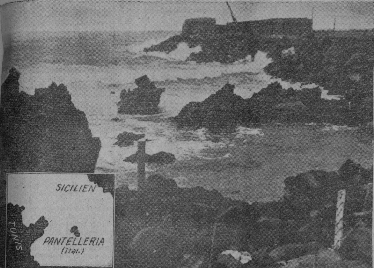
Vista parcial de un sector fortificado a la isla de Pantelaria, que se ha rendido a las fuerzas aliadas. En el ángulo superior inferior puede apreciarse la situación de la referida isla entre Túnez y Sicilia. De esta última dista unos cien kilómetros.

RENDCION DE PANTELARIA. Cuartel general aliado en África del Norte, 11 (urgente).—Un comunicado especial dice: