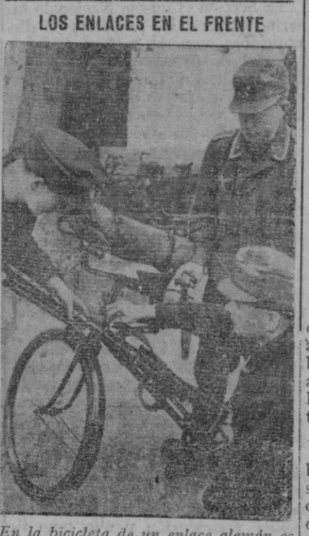
En la bicicleta de un enlace alemán es colocado un fusil ametrallador que le servirá para su dejensa en el caso de ser atacado por los soviets al cumplir su misión.