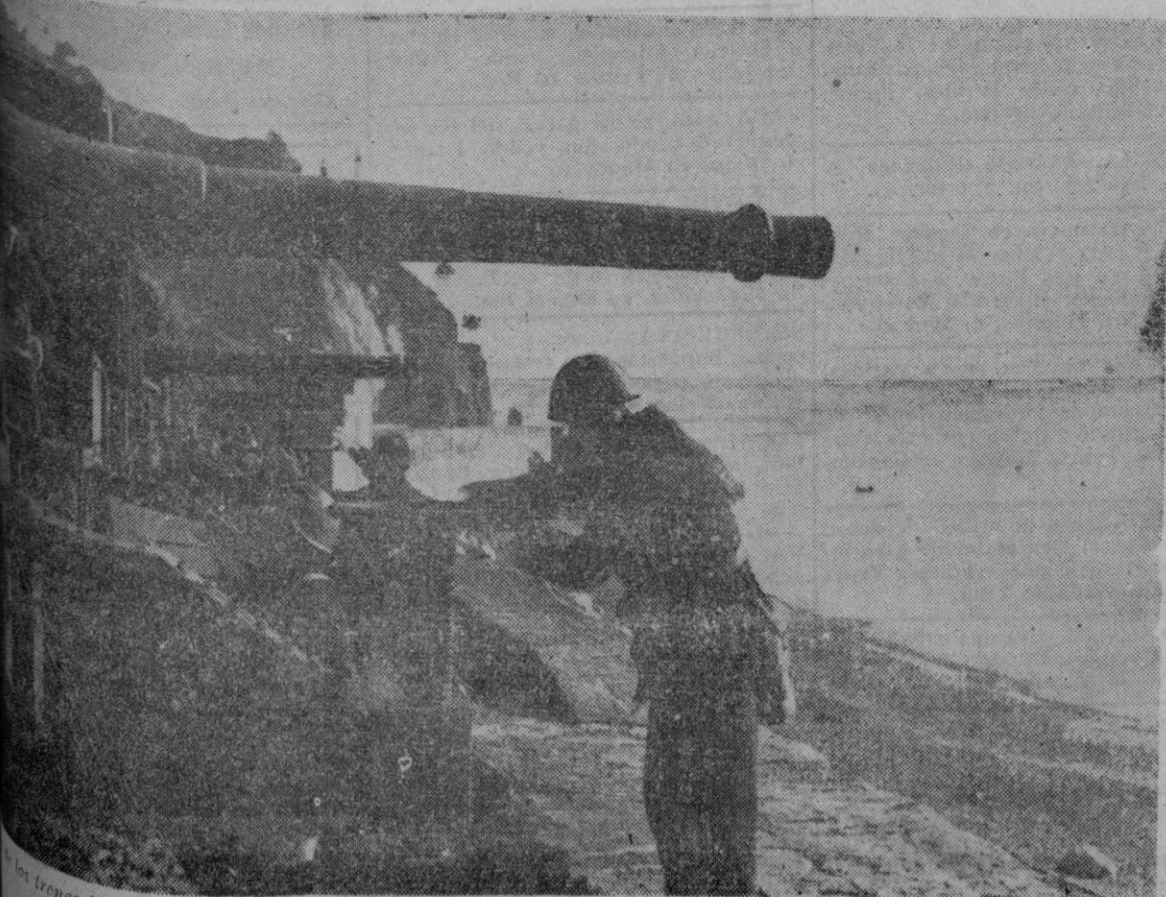
Armas blindadas, provisto de piezas de artillería de largo alcance, utilizados por el Ejército italiano para la defensa de la costa contra cualquier intento de invasión.