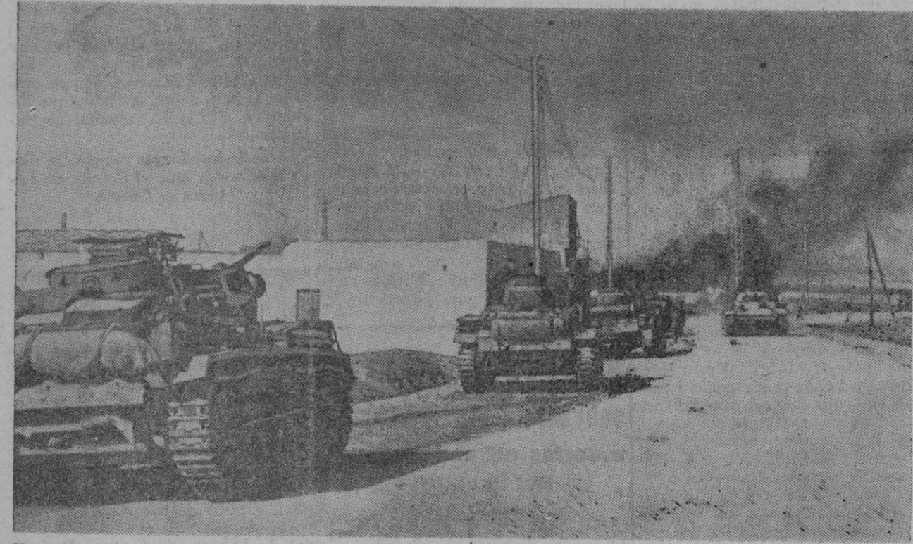
Una columna de tanques alemanes marchando por la carretera de Teburba, situada cerca de la capital tunecina. Atrás dejan un poblado en llamas a consecuencia de un bombardeo de la aviación aliada.

Las tropas italogermanas se defienden encarnizadamente