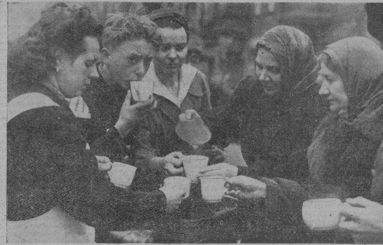
Después del bombardeo contra Berlín, los damnificados por las aviones son asistidos en las cocinas del Auxilio Social. En la fotografía vemos a varios de los damnificados tomando una taza de caldo.

Berlín, 29 (2 t.).—Aviones anglosajones han lanzado aisladamente bombas explosivas e incendiarias, durante la noche última, sobre localidades de la región costera del Noroeste de Alemania, así como en la Prusia oriental. Según las últimas informaciones, ocho aparatos plurimotrices de bombardeo han sido derribados.—Efe.