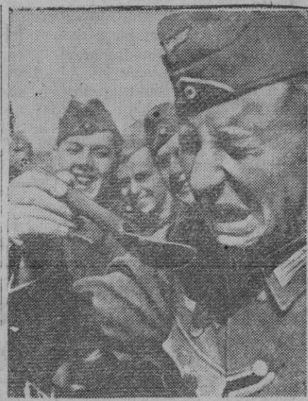
El aceite de hígado de bacalao no es, precisamente, una golosina, a pesar de todas sus virtudes nutritivas. Por eso no tiene nada de particular que este soldado alemán del frente del Este ponga una cara tan difícil al ingerir la cotidiana cucharadita, ante el regocijo de sus camaradas. Pero—dirá el protagonista de esta escena—retrá más quien sea el último.

Sevilla, 28.—A mediodía llegó el ministro de Trabajo, señor Girón, que fué cumplimentado por las autoridades y jerarquías, y que en el día de hoy, primero de feria, ha sido invitado para visitar varias casetas,