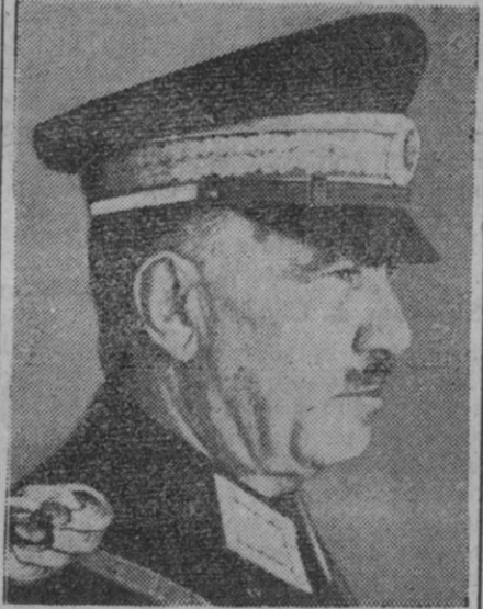
El mariscal Favzi Tsjakmak, comandante de la flota turca y jefe del Estado Mayor que, según una información de Ankara, no confirmada, tiene la intención de abandonar su cargo

Dieciocho bombarderos han sido abatidos sobre ALEMANIA