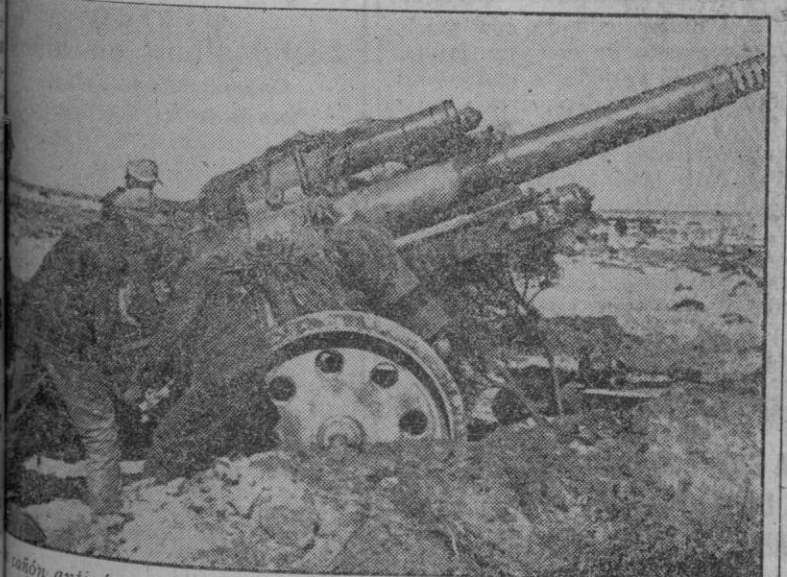
Cañón antiavión pesado alemán, es instalado en una nueva posición del frente tunecino

Las fuerzas franco-norteamericanas avanzan hacia Sened